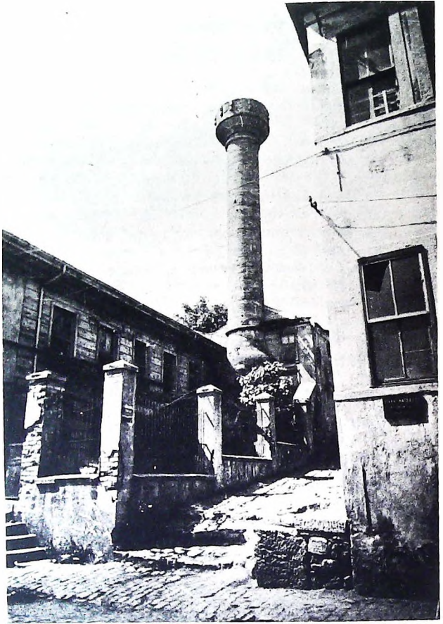
Gumüşhane Tekkesi'nin son zamanlarına ait bir fotoğraf. (Cami ve tekke temellerine kadar yıkılıp yok edilmiştir.)